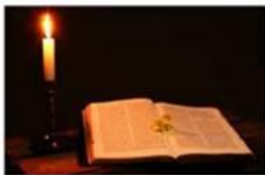
Real Candlelight = 1930K