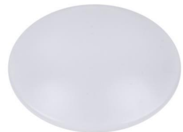
FLACKARP – mångsidig plafond IP65, IK10