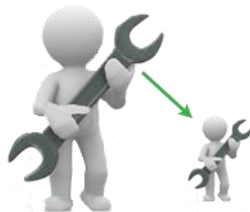
Lower maintenance costs