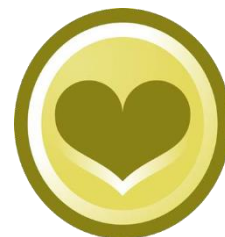
Increased road safety

LEDsystem Scandinavia och Greinon Engineering erbjuder en flexibel belysningsstyrning, baserad på trådlös kommunikation med 6LoWPAN och ZigBee , där användaren kan optimera energiförbrukningen genom ljusreglering i kombination med sensorer.