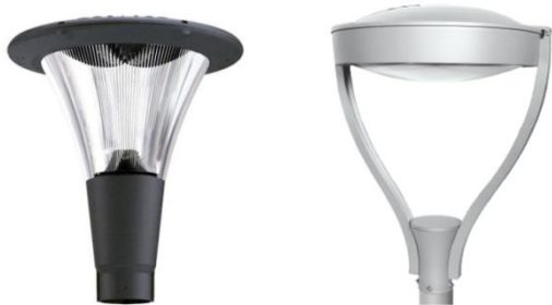
VIKEN – parkarmatur för grönytor, parker, innergårdar

Urval av armaturer från LEDsystem Scandinavia. Lämpliga för styrning med Intelligent Light Control.