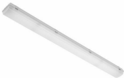
SAXTORP - industriarmatur för tuffa miljöer